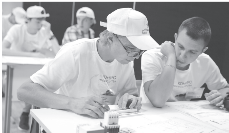
В Ульяновском авиаколледже будет тренироваться национальная команда во время подготовки к внутренним и международным чемпионатам профмастерства WorldSkills

Областной минобр планирует выстроить так называемую рамочную структуру функционирования будущего центра. Первая рамка - исследовательская, которая будет опираться на опыт других стран - Китая, Кореи, Германии, Бразилии. На основании исследований будут разрабатываться эффективные технологии подготовки. Вторая рамка - историческая. В ее основе - технология развития системы профессионально-технического образования, которая в этом году отметила свое 75-летие. Матрица тренировочных сборов участни-